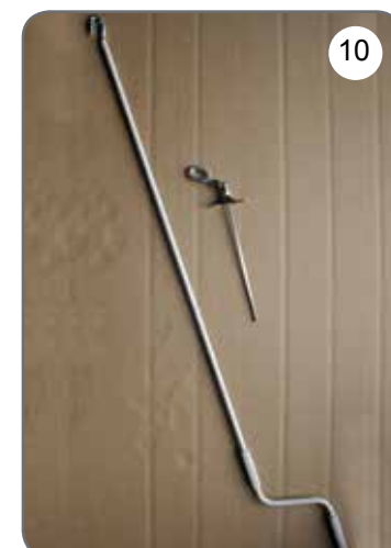
Korba, przegub Cardana 45° lub 90° z uchem [10].