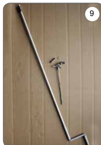
Korba, przegub Cardana 45° lub 90° z zaczepem dzwinkowym [9].