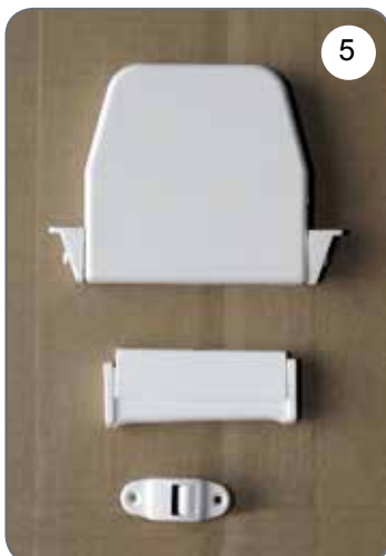
Zwijacz na taśmę (pasek), prowadnica taśmy (paska), uchwyt taśmy (paska) [5].

b) Rodzaje stosowanych napędów ręcznych (opcje):