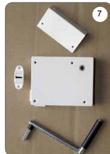
Kaseta z przekładnią na taśmę (pasek), płytka do mocowania kasety, prowadnica taśmy (paska), korba [7].