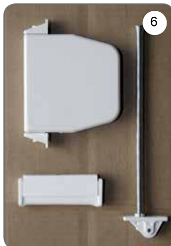
Zwijacz na linkę, prowadnica linki, uchwyt linki [6].