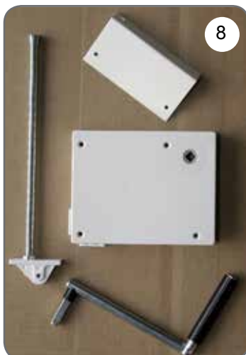
Kaseta z przekładnią na linkę, płytka do mocowania kasety, prowadnica linki, korba [8].